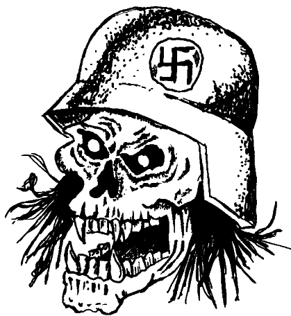
Kiinnitä erityistä huomiota kasvojen maalaamiseen.

Mustetta voi käyttää pesussa normaalisti, kuten aiemmin mainitsin, mutta kokeilepa käyttää sitä ritareihin ja muihin peltiheikkeihin.